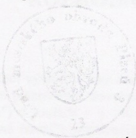
Eva Hubená vedoucí odboru výstavby Úřadu městského obvodu Plzeň 3

Společné rozhodnutí má podle § 94a odst. 5 stavebního zákona platnost 2 roky. Stavba nesmí být zahájena, dokud rozhodnutí nenabude právní moci.